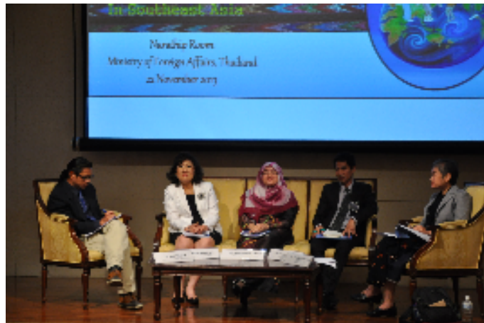
บรรยายภาศการอภิปรายในหัวข้อ The State of Human Rights and Peace Education in South East Asia and the Ways Forward